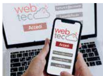
Pannello di accesso alla piattaforma WebTec

mente il proprio brand e la propria immagine. L'offerta WebTec è veramente ampia ed è stata ideata all'insegna della semplicità, grazie anche al pannello di gestione che consente l'attivazione di servizi e funzioni: fattura elettronica (PA Digitale è soggetto accreditato allo SDI), gestore documentale e conservazione digitale a norma con workflow integrato e firma digitale, organizzazione dei processi dello studio/azienda (tramite workflow processuale), servizi di integrazione con l'Agenzia delle Entrate e quadratura cassetto fiscale, gestione strutturata delle PEC, webmail, gestione pratiche, agenda mobile, prenotazioni on line degli appuntamenti, servizi di collaborazione & communication per la massima condivisione di dati e documenti con clienti/associa-